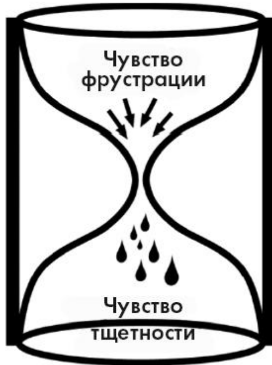
Иллюстрация б. От гнева моря – к океану горя. Когда ребенок чувствует тщетность, его эмоциональная система освобождается от застоявшейся фрустрационной энергии

жалая ребенка, сочувствуя ему, помочь прийти к облегчающим его горе слезам тщетности. Когда энергия фрустрации может вытечь со слезами или найти свой выход через вербально выраженное горе, ребенок расслабляется и мозг запоминает этот путь – путь адаптации.