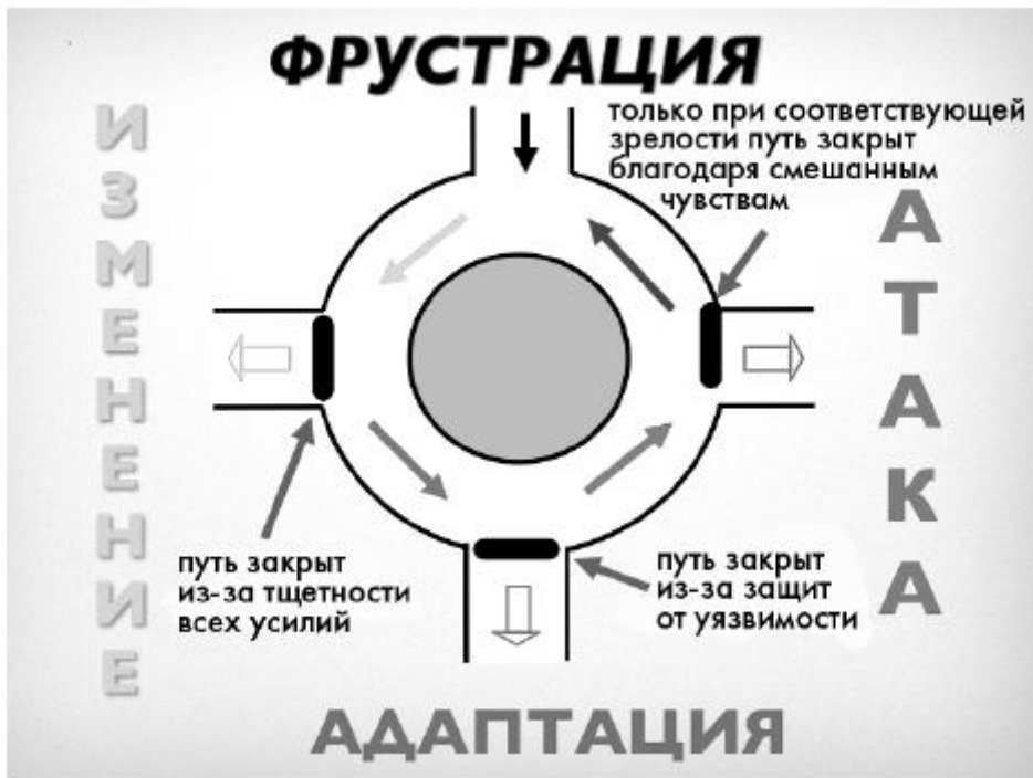
Иллюстрация 7. Причиной агрессии ВСЕГДА является фрустрация, причина возникновения которой не может быть устранена, и при которой не ощущается печаль, в то время как агрессивные импульсы ничем не сдерживаются, по крайней мере, в настоящий момент.

У агрессии множество лиц. Агрессией являются не только пинки, плевки, укусы, удары, мысли о самоубийстве и мечты о насилии, но также и упреки, бойкоты, насмешки, презрение, лишение любви или связывание «любви» с определенными условиями. Бывают не только агрессивные дети, но и агрессивные родители.