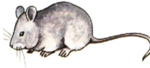
мышка - норушка