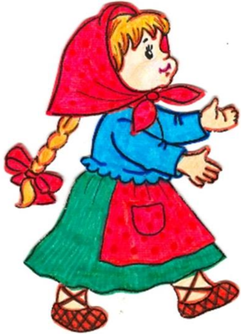
Внучка - хохотушка