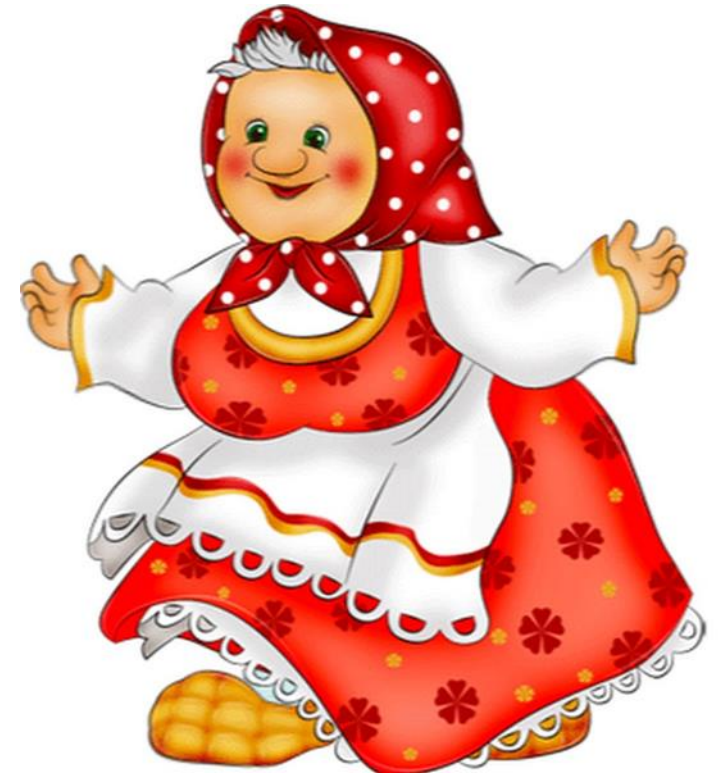
Бабушка - старушка